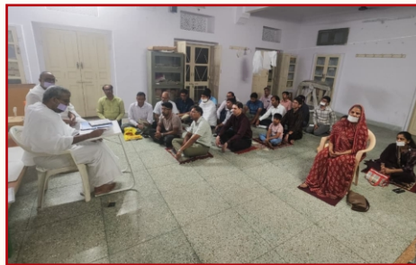
एक शाम महावीर के नाम-जयपुर