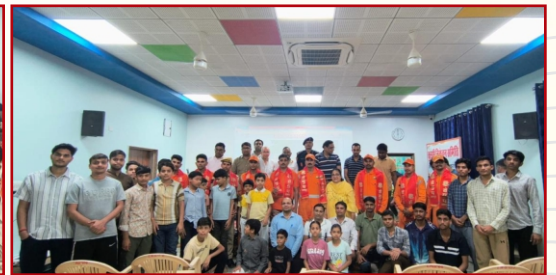
टीटीएफ फिजीकल मिशन एंपावरमेंट कार्यशाला-उदयपुर (15 मार्च 2026)