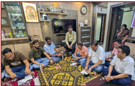
धम्म जागरण-साउथ हावड़ा