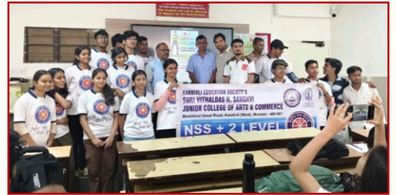
टीटीएफ फिजीकल मिशन एंपावरमेंट कार्यशाला-विरार, मुंबई (07 मार्च 2026)