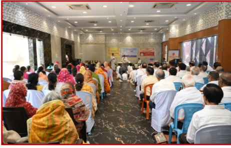
व्यक्तित्व विकास कार्यशाला-उत्तर कोलकाता