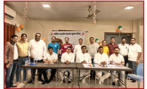
तेयुप पूर्वाचल कोलकाता