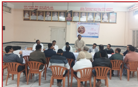
तेयुप बरपेटा रोड़