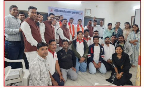
तेयुप अमराईवाड़ी ओढव