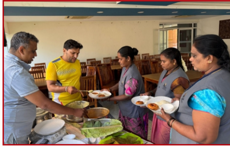
सेवा कार्य-टी. दासरहल्ली