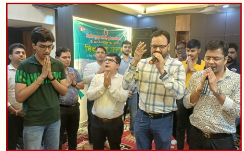
धम्म जागरण-पूर्वांचल कोलकाता