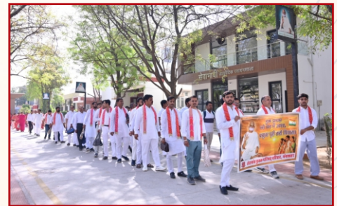
लाडनू कॉलिंग यात्रा-गंगाशहर