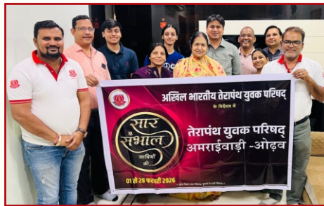
तेयुप अमराईवाड़ी ओढव